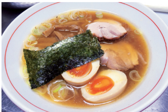
煮干し香る中華そば

毎月発行しているクローズアップしもすわで、町内の企業を紹介します。内容は各会社から提出いただいた原稿を基に掲載しています。掲載を希望する企業は下諏訪町 総務課 情報防災係（電話27-1111 内線262）までご連絡ください。